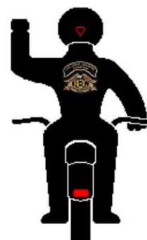
Linkerarm horizontaal omhoog