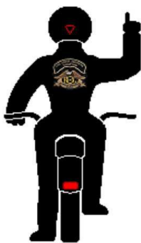
Start de motoren Linkerbocht Met je linker- of rechterarm