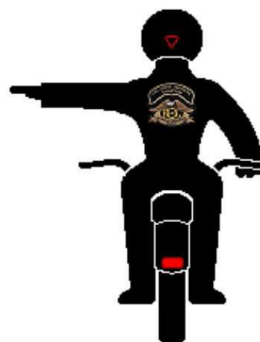
Rechterbocht Linkerarm horizontaal omhoog met